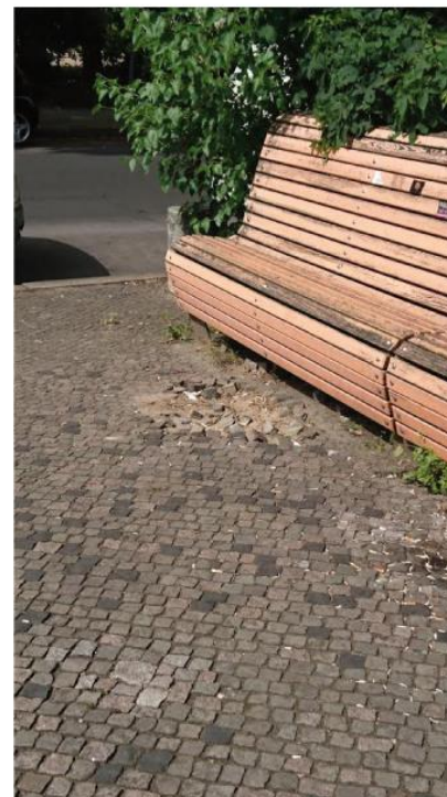
In der Triftstraße