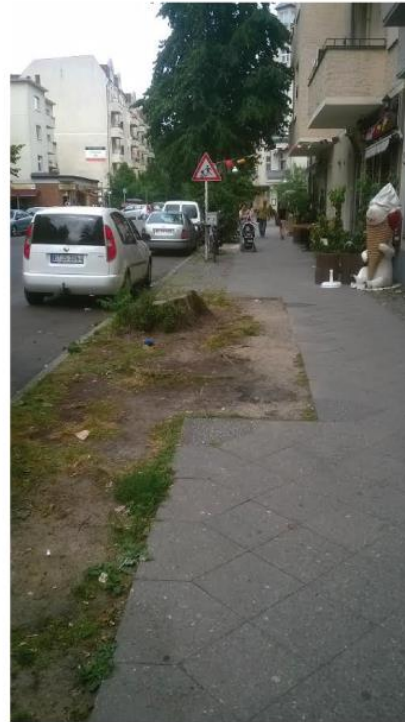
Vor der Sprengelstr. 40