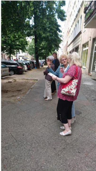
Beim Kiezspaziergang

Fotodokumentation zum Kiezspaziergang vom 04.07.2016