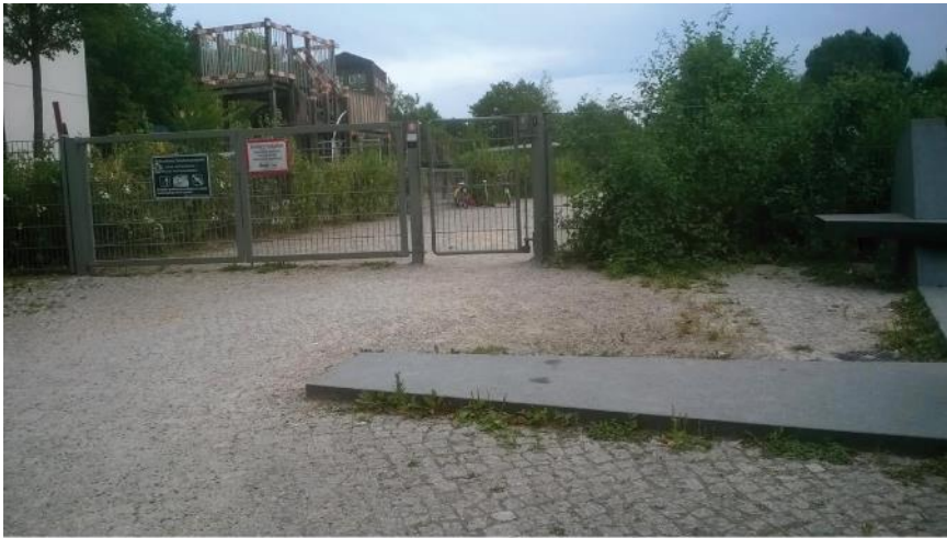
Der Denkmalsockel am Sprengelpark