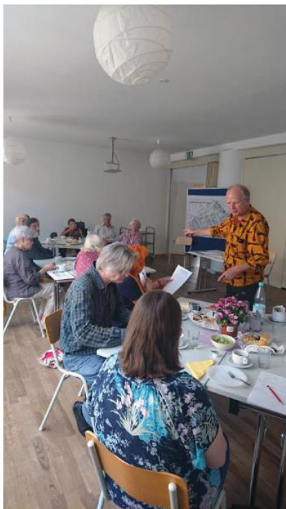
Sammeln der Eindrücke im SprengelHaus