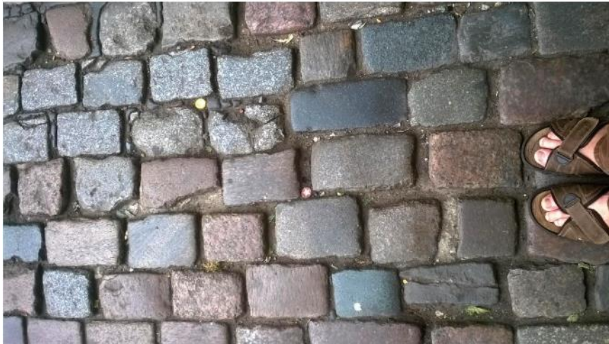
Lücken im Kopfsteinpflaster in der Torfstraße