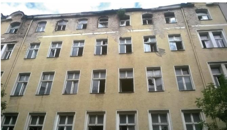
„Suchbild. Wo wurde dieses Foto aufgenommen? Gewinn: für die ersten drei richtigen Antworten gibt es je 1 Gutschein für ein Mittagessen mittwochs im Nachbarschaftsladen!“